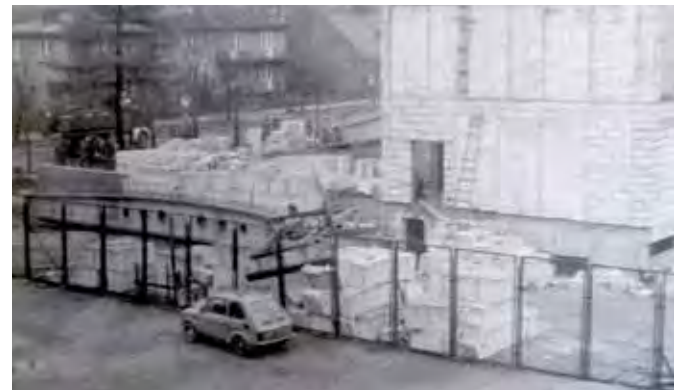
Budowa sali gimnastycznej

25 lutego 1985 roku szkoła przeżyła chwile grozy. W szatni na strychu budynku szkolnego wybuchł pożar. Dzięki akcji straży pożarnej oraz sprawnej ewakuacji nauczycieli i uczniów nikomu nic się nie stało. Na przełomie 1985 i 1986 roku zmienił się stan liczebny klas. Część uczniów przeszła do nowo wybudowanej Szkoły Podstawowej nr 7, jednak nie rozwiązało to problemów lokalowych i lekcje nadal odbywały się na korytarzu, w harcówce, gabinecie pedagoga i pokoju nauczycielskim. Dopiero w 1987 roku została zbudowana sala gimnastyczna, z której korzystali uczniowie obu szkół. Rok później dobudowano łącznik między salą a budynkiem szkoły, a w przylegających do niego pomieszczeniach ulokowano Miejski Zespół Ekonomiczno-Administracyjny Szkół (po jego likwidacji mieściła się tu do 1993 roku Delegatura Kuratorium Oświaty w Suwałkach).