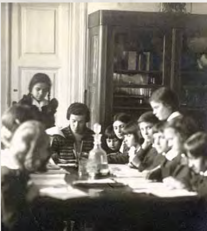
Praca w czytelni, 1929 rok