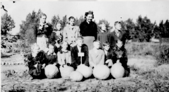
Członkowie „kółka młodych Miczurinowców” przy Szkole Podstawowej nr 1 z plonami ze szkolnego ogródka, 1954 rok