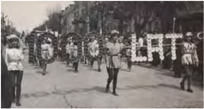
Obchody 1000-lecia Państwa Polskiego