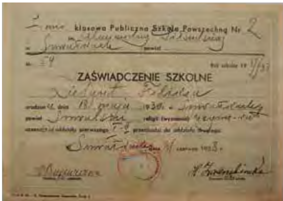
Zaświadczenie szkolne uczennicy Szkoły Powszechnej nr 2 im. Aleksandry Piłsudskiej