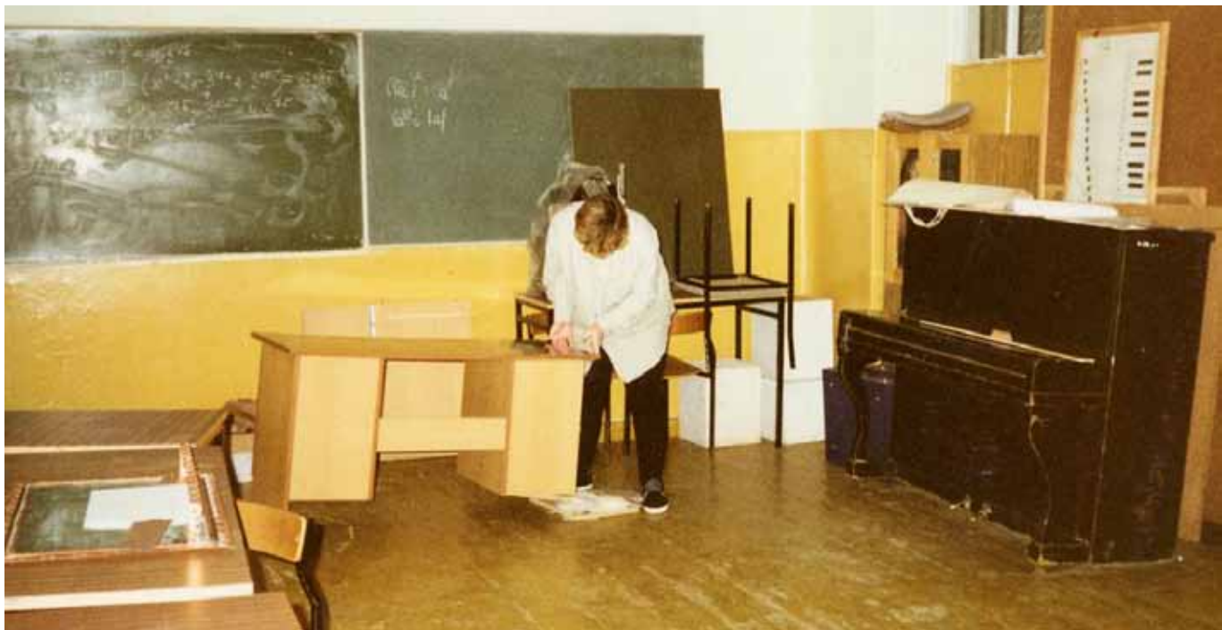
W latach 90. wiele remontów klas i wyposażenia przeprowadzono własnymi siłami