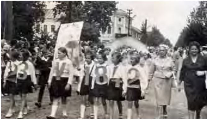
„Barwny korowód” uczniów szkół nr 1 i 2 w czasie uroczystości odsłonięcia pomnika Marii Konopnickiej, 25 i 26 maja 1963 roku