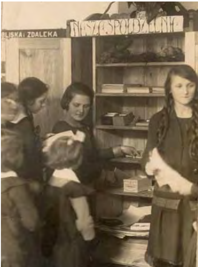
Sklepik szkolny, 1930/1931 rok