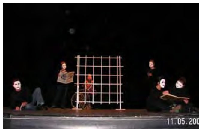
Przedstawienie pt. „Maska”