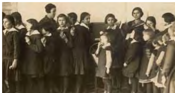
„Dożywianie dzieci fizycznie słabych tranem i bułkami”, 1929 rok