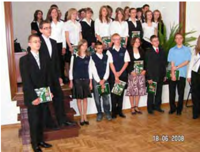
Laureaci konkursów przedmiotowych

Szkoła Podstawowa nr 2 i Gimnazjum nr 1 tworzące Zespół Szkół nr 8 to placówki z atrakcyjną i bogatą ofertą edukacyjną: ambitnymi i sprawdzonymi programami, obowiązkową nauką dwóch języków obcych, licznymi kołami zainteresowań (przedmiotowymi, artystycznymi, sportowymi), zajęciami konsultacyjnymi oraz zespołami wyrównywania wiedzy. Ich uczniowie mogą korzystać z bogatych zbiorów biblioteki, czytelnicy i centrum multimedialnego oraz obiektów sportowych. Szkoła nie tylko przekazuje wiedzę, uwrażliwia też na problemy współczesnego świata, uczy dostrzegać potrzeby drugiego człowieka oraz śmiało realizować własne marzenia.