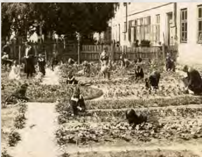
Uczennice podczas pracy w szkolnym ogródku w podwórzu kamienicy przy ul. Tadeusza Kościuszki 40, kwiecień 1928 roku