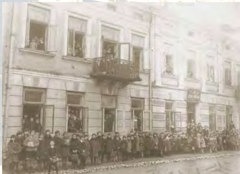
Uczniowie przed budynkiem Szkoły Powszechnej nr 2 przy ul. Kamedulskiej 16, wrzesień 1928 roku