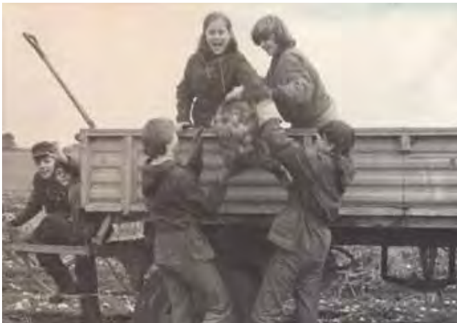
Wykopki szkolne, 1978 rok