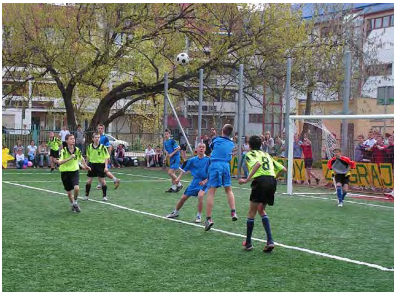
Oddanie do użytku boiska ze sztuczną nawierzchnią i mecz inauguracyjny