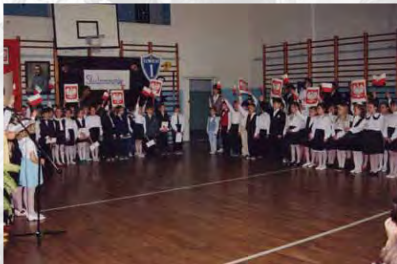
Ślubowanie klas pierwszych