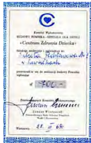
Dyplomy i podziękowania za udział w zbiórkach na cele społeczne

13 października 1973 roku uroczystie świętowano 200. rocznicę ustanowienia Komisji Edukacji Narodowej. W tym dniu z inicjatywy komitetu rodzicielskiego szkoła nr 2 otrzymała nowy, drugi w swojej historii sztandar.