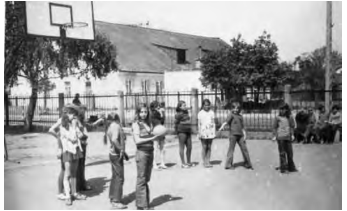
Na szkolnym boisku