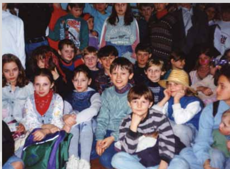
Szkolne spotkania i zabawy