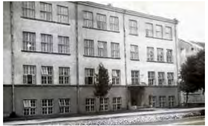
Budynek Szkół Podstawowych nr 1 i 2, lata 60. XX wieku

Grono pedagogiczne i uczniowie uczestniczyli też w najważniejszych wydarzeniach w życiu miasta: odsłonięciu obelisku na placu straceń (6 września 1959 roku), obchodach 50. rocznicy śmierci Marii Konopnickiej i akcie wmurowania kamienia węgielnego pod