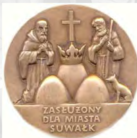
Medal „Zasłużony dla Miasta Suwałk” przyznany przez Radę Miejską Szkole Podstawowej nr 1

Tak jak i w latach wcześniejszych uczniowie Szkoły Podstawowej nr 2 włączają się do konkursów i akcji prowadzonych nie tylko w szkole, ale i na terenie miasta. Uczestniczą w akcjach: „Sprzątanie Świata”, „Góra Grosza”, biorą udział w programach profilaktycznych. W latach 2002–2004 roku współpracowali z Podstawową Szkołą Polską w Jekabpils na Łotwie. Wolontariusze wspomagają Wielką Orkiestrę Świątecznej Pomocy i inne działania mające na celu pomoc potrzebującym. Od 2002 roku szkoła angażuje się w akcję selektywnej zbiórki surowców wtórnych i odnosi duże sukcesy. Przez kilka lat plasowała się na I miejscu, otrzymując w nagrodę sprzęt komputerowy.