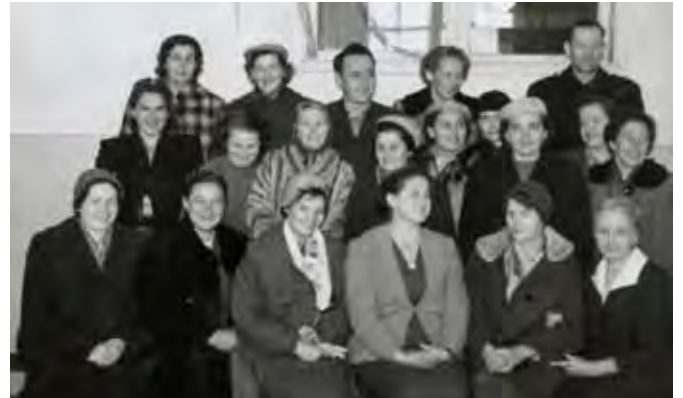
Grono pedagogiczne Szkoły Podstawowej nr 1 w czasie obchodów Dnia Nauczyciela w 1959 roku