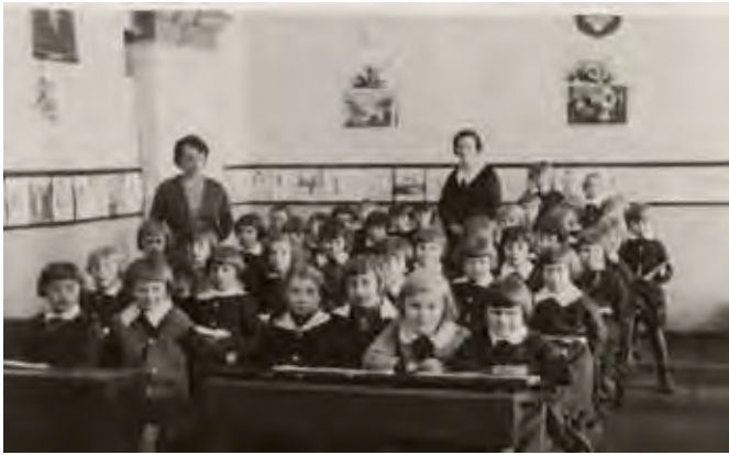
Hospitacja w klasie II, 22 maja 1933 roku