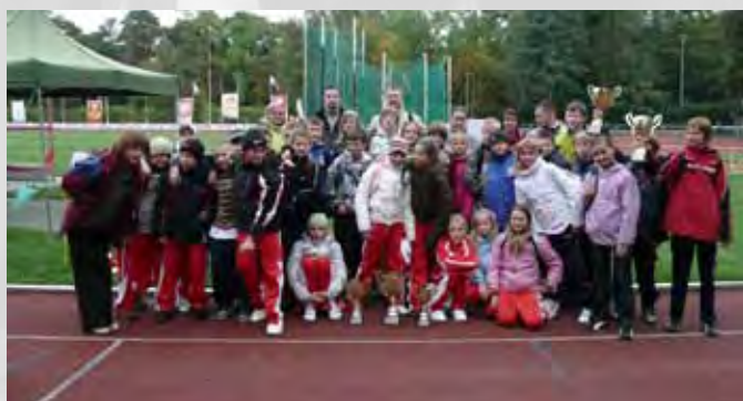
Drużyna Szkoły Podstawowej nr 2 – zwycięzca Podlaskiej Olimpiady Młodzieży