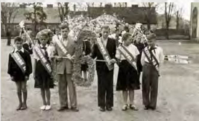
„Przodownicy nauki” Szkoły Podstawowej nr 1 w czasie obchodów Dni Oświaty Książki i Prasy w 1957 roku