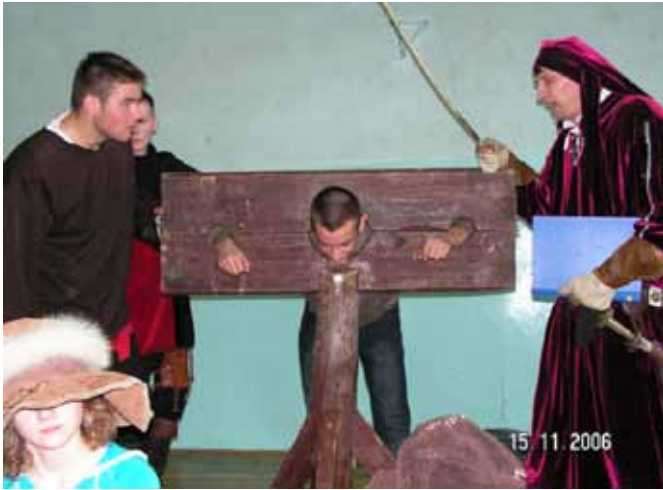
„Żywa lekcja historii”