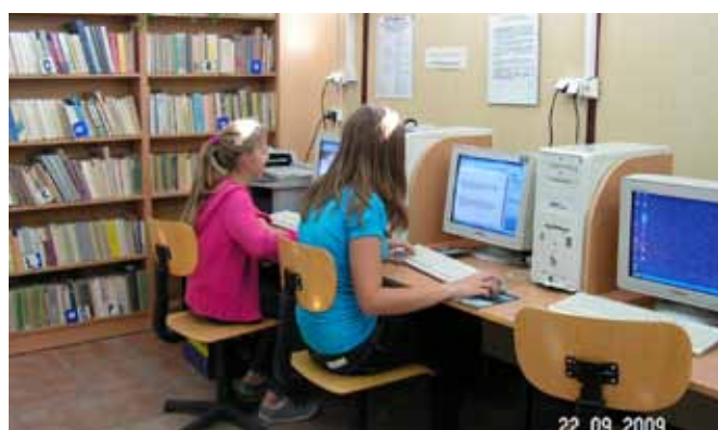
Biblioteka i centrum informacji multimedialnej