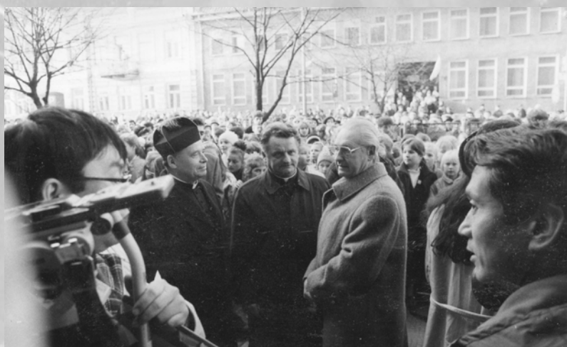
Uroczystości wręczenia sztandaru i nadania Szkole Podstawowej nr 1 imienia Marszałka Józefa Piłsudskiego 11 listopada 1989 roku. Wśród gości m.in. Andrzej Wajda