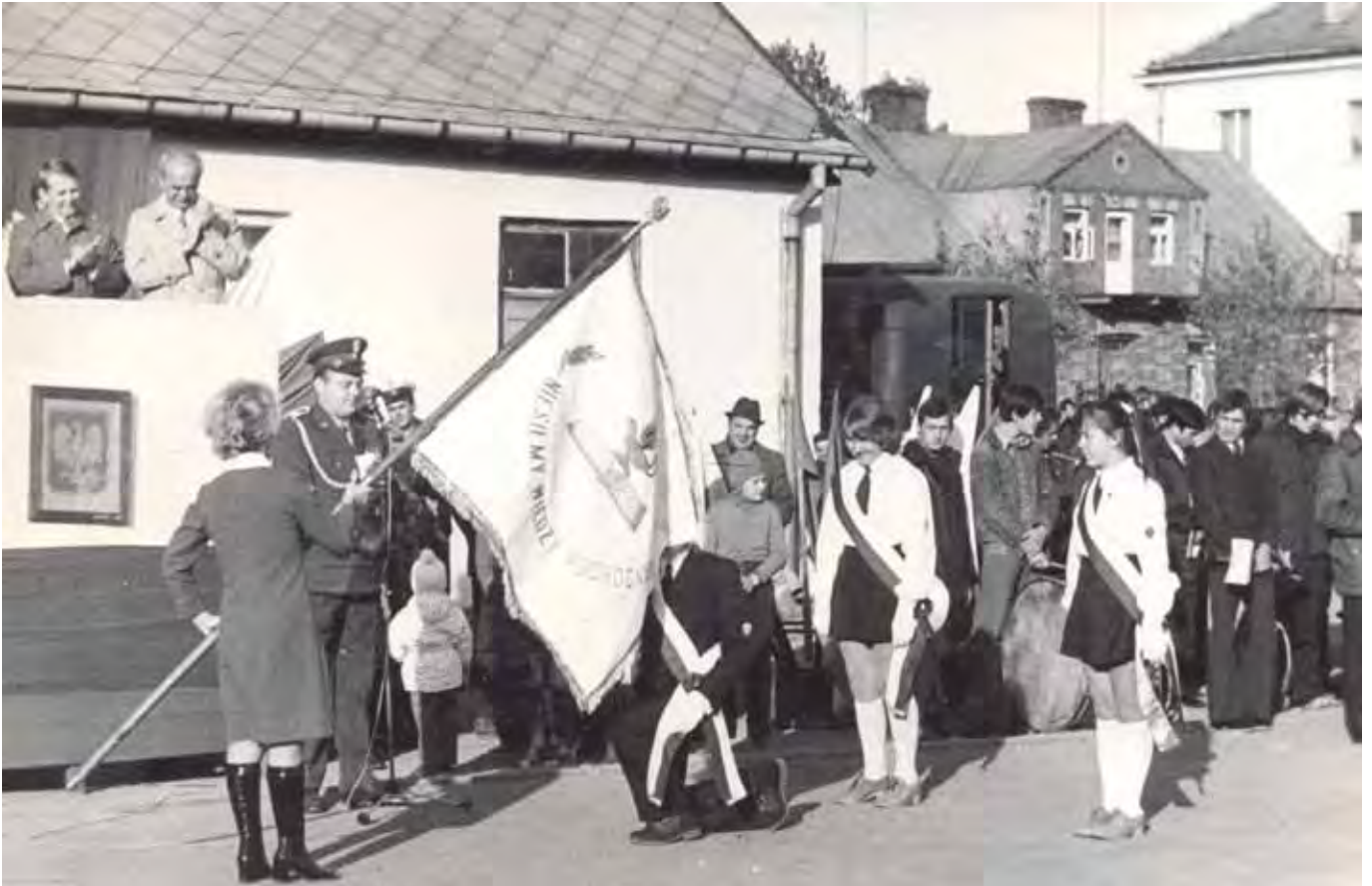
Uroczystość wręczenia nowego sztandaru dla Szkoły Podstawowej nr 2