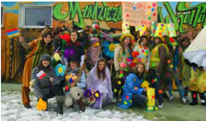
Pierwszy dzień wiosny