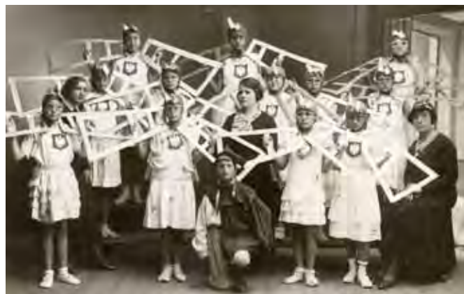
Szkolne uroczystości z okazji tygodnia LOPP – „efektowny taniec samolotów”, 21 maja 1933 roku

Już w początku 1922 roku ze względu na trudne warunki materialne wielu uczennic rozpoczęto w szkole akcję dożywiania, którą kontynuowano w latach następnych. Ze środków zarządu miasta i funduszy zgromadzonych w ramach zbiórek zakupiono najuboższym uczennicom podręczniki szkolne oraz odzież (np. w styczniu 1926 roku 30 dziewcząt otrzymało obuwie i palta). Rokrocznie w czasie świąt rozdzielano paczki żywnościowe i słodczyce. Uczniowie