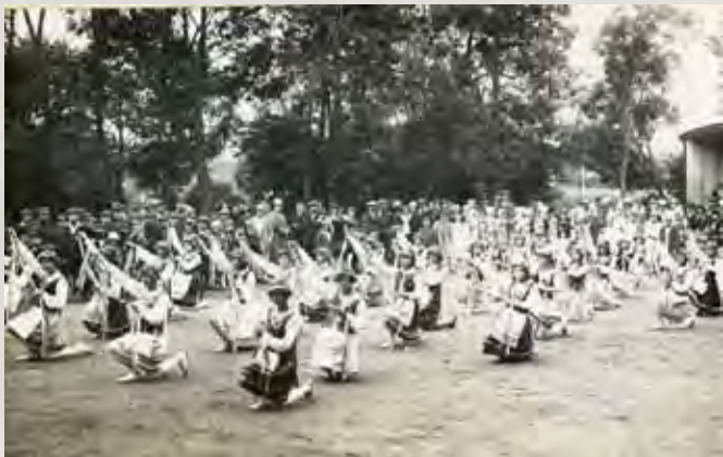
„Popisy gimnastyki rytmicznej” w parku miejskim, czerwiec 1928 roku