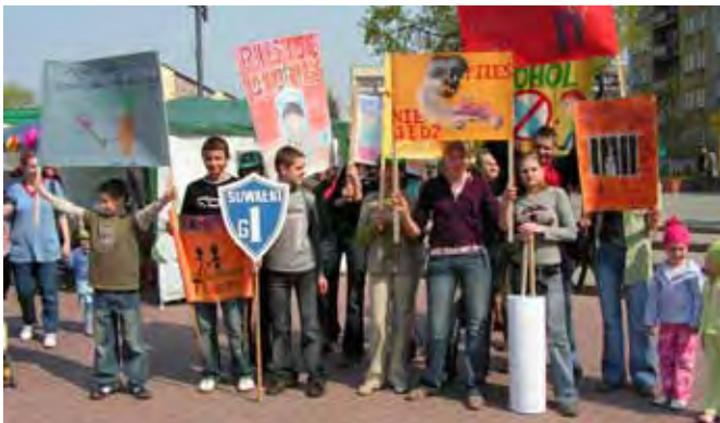
Akcja profilaktyczna i promująca zdrowy tryb życia

w wyjazdach m.in. do zaprzyjaźnionego z Suwałkami Grande-Synthe we Francji, a gośćmi „Jedynki” była młodzież z College du Moulin.