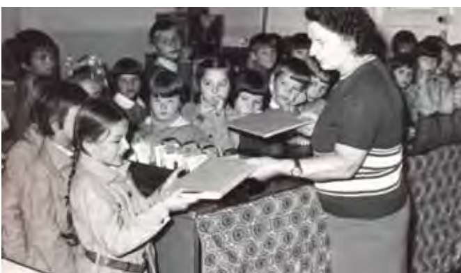
Biblioteka Szkoły Podstawowej nr 1