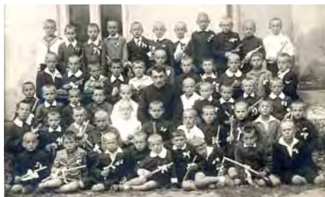
Uczniowie klasy III Szkoły Powszechnej Numer 1 przystępujący do pierwszej komunii świętej, 1933 rok