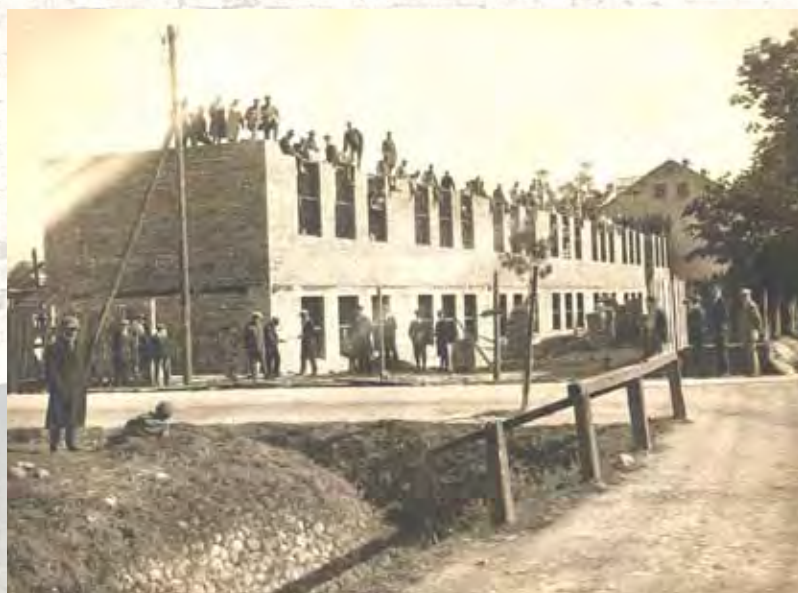
Budowa nowego gmachu szkół powszechnych