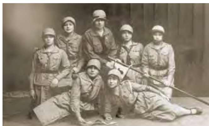
Drużynowa Wilczyńska i zastępowe szkolnej drużyny harcerskiej, czerwiec 1927 roku