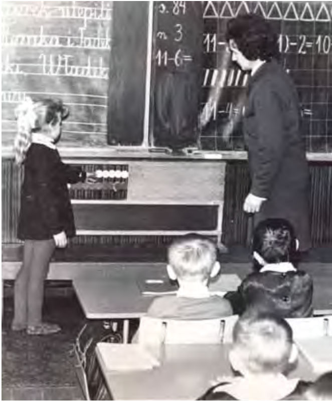
W czasie lekcji