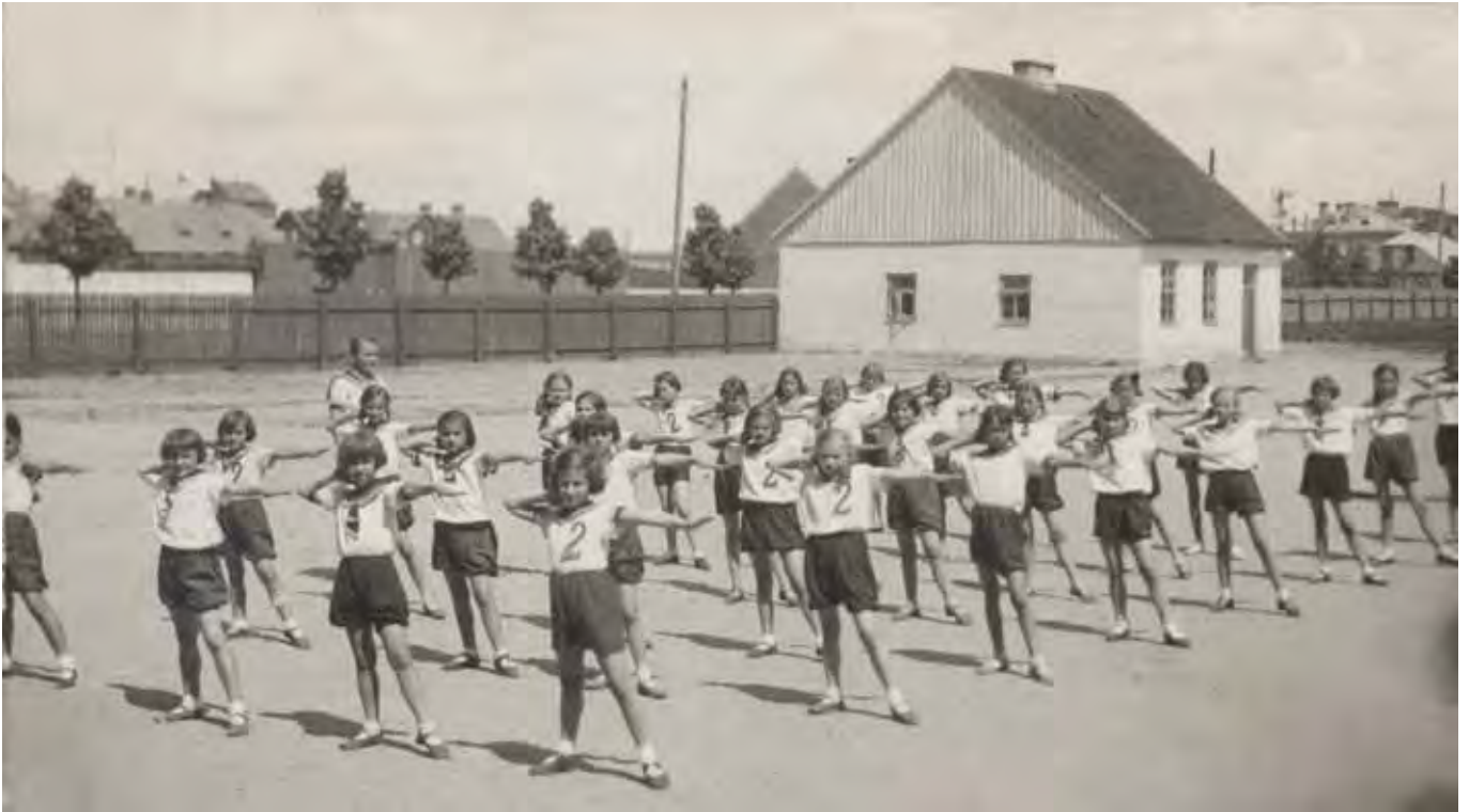
Popisy gimnastyczne uczennic Szkoły Powszechnej nr 2 na stadionie miejskim, 11 czerwca 1936 roku