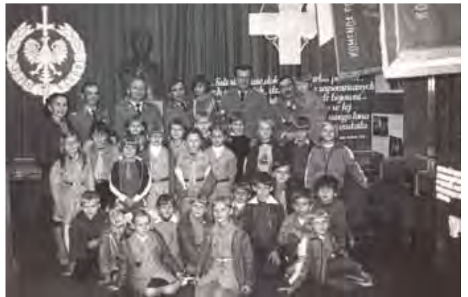
Spotkanie z funkcjonariuszami Milicji Obywatelskiej, 1985 rok