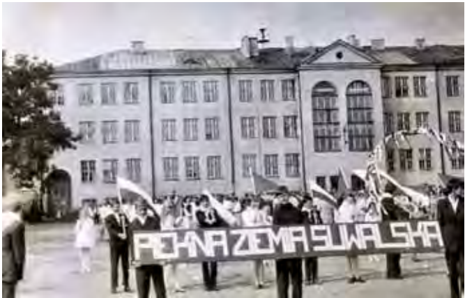
Obchody 250-lecia nadania praw miejskich Suwałki, 1972 rok