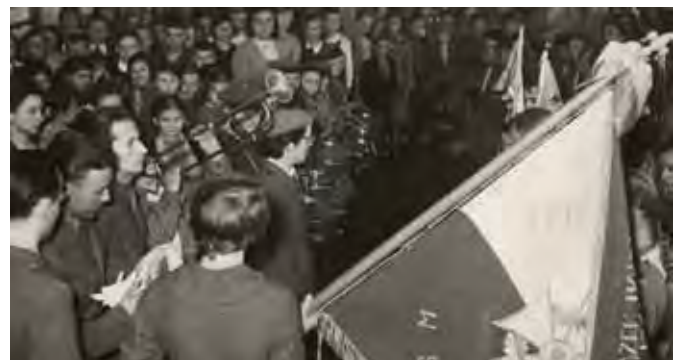
Wręczenie sztandaru dla 4. Żeńskiej Drużyny Harcerskiej przy Szkole Podstawowej nr 1, 29 kwietnia 1959 roku