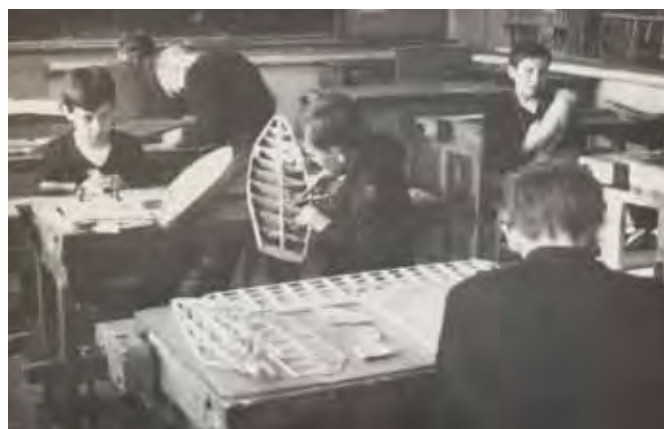
Uczniowie z kółka modelarskiego, 1967 rok