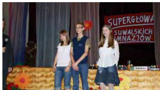
„Superłowy” Gimnazjum nr 1

Szkoła od wielu lat prowadzi akcję selektywnej zbiórki surowców wtórnych, a zaangażowanie w nią uczniów zostało wielokrotnie docenione. W 2003 roku w nagrodę za udział w konkursie do szkolnej biblioteki trafił pierwszy komputer. W roku szkolnym 2007/2008 szkoła przodowała we wszystkich kategoriach konkursu, zdobywając I miejsce w kategorii „Najlepszy uczeń w zbiorce makulatury”, I miejsce w kategorii „Najlepsza praca plastyczna”, II miejsce w kategorii „Najlepsza szkoła”.