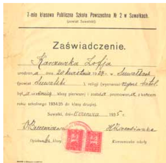
Zaświadczenie 7-klasowej Szkoły Powszechnej nr 2