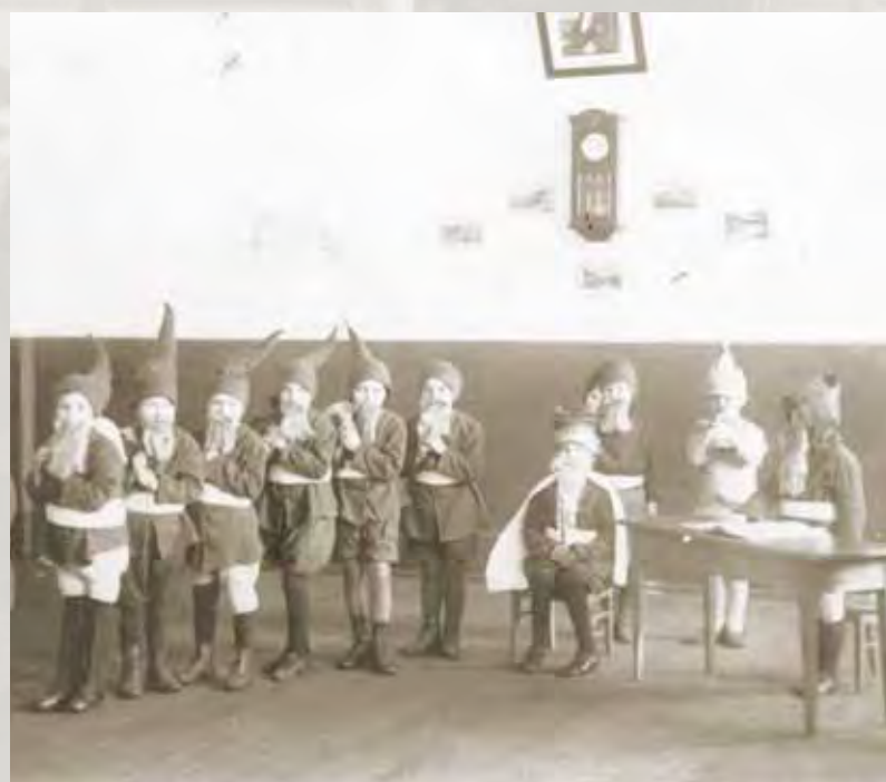
Przedstawienie szkolne „W królestwie krasnoludków” Or-Ota, 12 stycznia 1925 roku