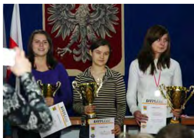
Laureatki zawodów sportowych