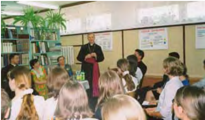
Spotkanie z biskupem ełckim Edwardem Samsel