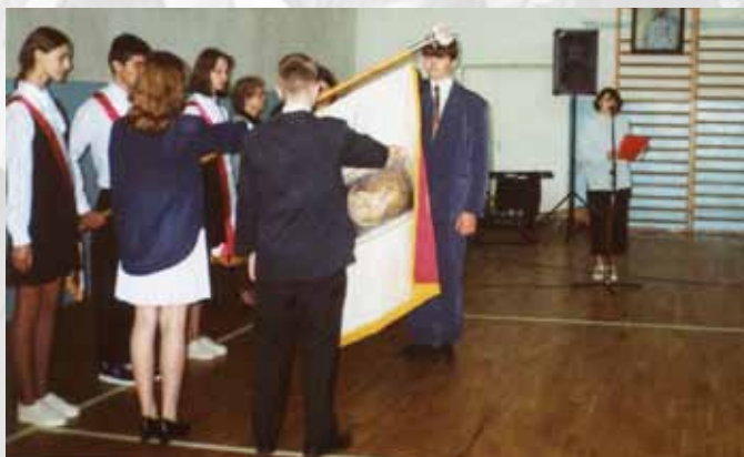
Przekazanie sztandaru nowemu pocztowi