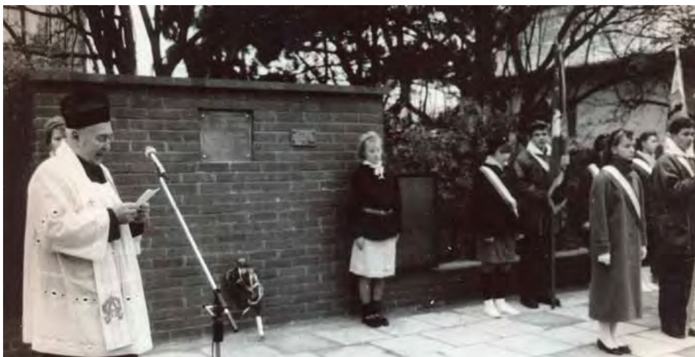
Odsłonięcie tablicy przy ulicy Wawrzyńca Gałaja upamiętniającej miejsce urodzenia Aleksandry Piłsudskiej ze Szczerbińskich, 1990 rok