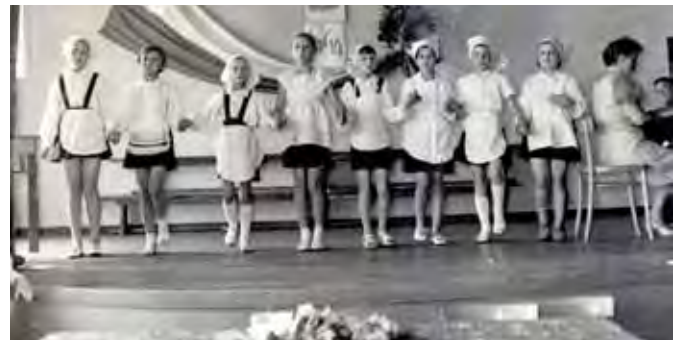
Akademia 1-majowa w Szkole Podstawowej nr 1 w 1965 roku. W podpisie pod zdjęciem w szkolnej kronice napisano: „Montażem, tańcem, pływaniem i pieśnią majową utrzymujemy tradycję klasy robotniczej”