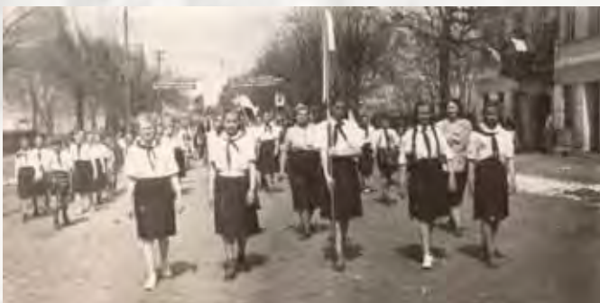
1 Maja 1953 roku