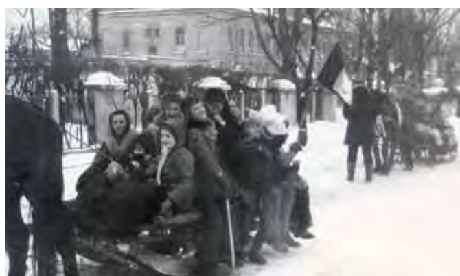
Członkowie koła turystyczno-krajoznawczego przy Szkole Podstawowej nr 1 na kuliżu

motopompa. W tym samym roku powstał projekt budowy przy szkole sali gimnastycznej. Po apelu Komitetu Rodzicielskiego o wpłaty na rzecz inwestycji udało się zgromadzić imponującą kwotę 50 tys. złotych. Budowę sali zrealizowano jednak znacznie później.