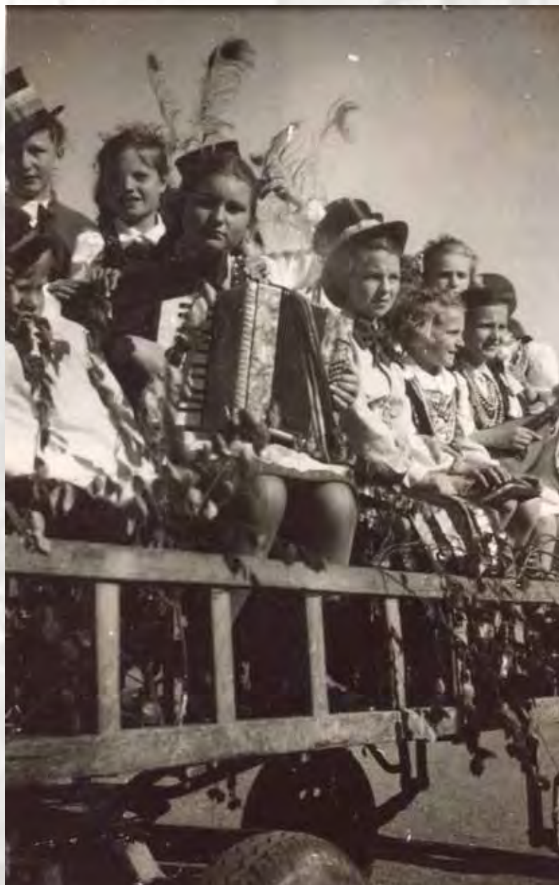
Święto Pieśni, maj 1945 roku