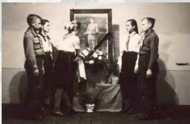
Warta uczniowska podczas uroczystości związanych z pogrzebem Józefa Stalina, 1953 rok