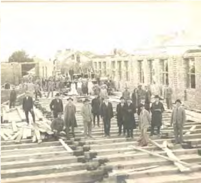
Wizytacja robót przez przedstawicieli rady miejskiej