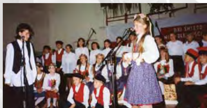
Apel z okazji 11 listopada