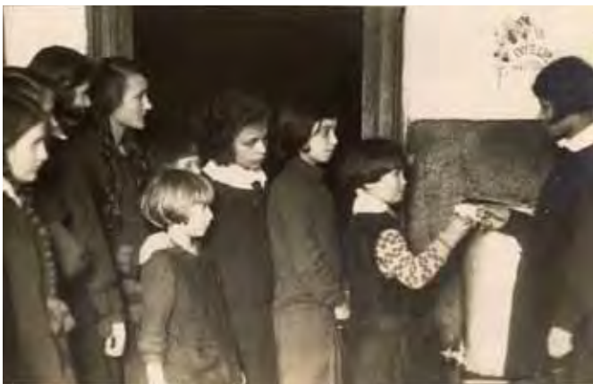
W czasie dyżuru, 1930/1931 rok

i nauczyciele włączali się również w inne akcje. Na przykład w końcu 1921 roku zorganizowano przedstawienie „Gwiazdka Michasia”, z którego dochód przeznaczono na zakup książek do szkolnej biblioteki. W grudniu 1923 roku przeprowadzono zbiórkę pieniędzy „dla Japończyków dotkniętych klęską trzęsienia ziemi”, a 3 maja 1927 roku zebrano 47 złotych na „Dar Narodowy”. Wielokrotnie organizowano przedstawienia szkolne, a po przekazaniu szkole zakupionego przez rodziców „aparatu kinematograficznego” również seanse filmowe, z których dochód przeznaczano między innymi na wycieczki szkolne lub cele dobroczynne. Od stycznia do marca 1924 roku nauczycielki pracowały na kursach dla analfabetów. Co roku z okazji świąt państwowych i rocznic historycznych organizowano okolicznościowe obchody i akademie.