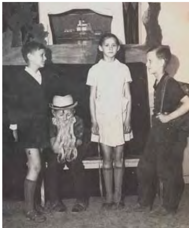
Artyści teatryku „Tyci – tyci” podczas próby sztuki „Janosik”, ok. 1969 rok