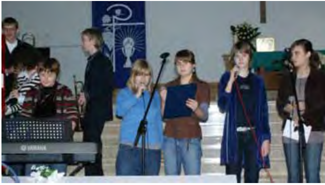
Występ zespołu „Ewenement”