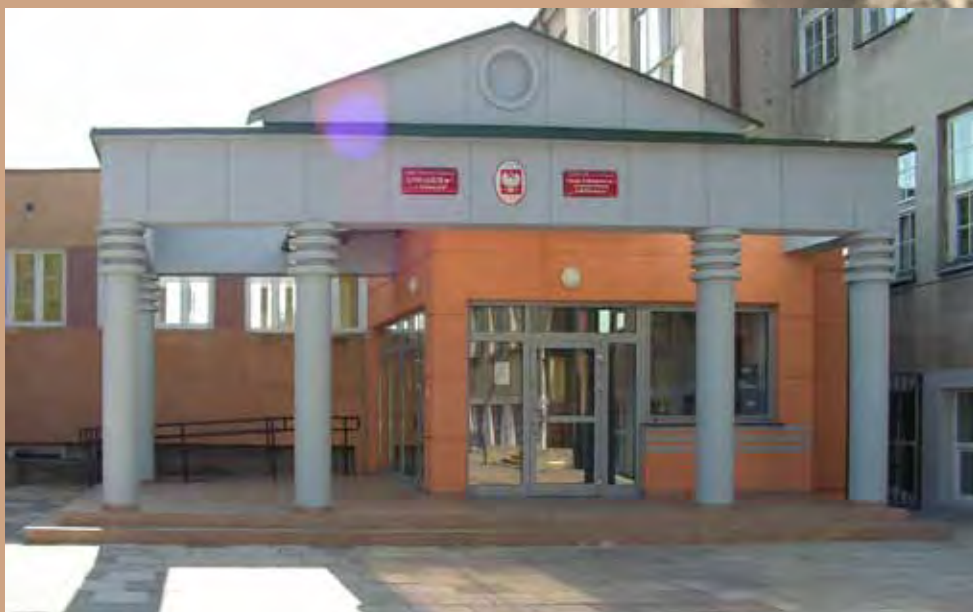
Zespół Szkół nr 8 Suwałki, ul. T. Kościuszki 126