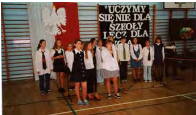
Uczniowie pierwszego rocznika gimnazjalistów

W kalendarzu szkolnych uroczystości stałe miejsce zajmują apele i wieczornice organizowane z okazji świąt państwowych i rocznic ważnych wydarzeń historycznych. Co roku uczniowie uczestniczą w spotkaniach wigilijnych, andrzejkach, pierwszym dniu wiosny, dniach sportu szkolnego, połowinkach, Dniu Edukacji Narodowej i Dniu Europejskim. Tradycją stały