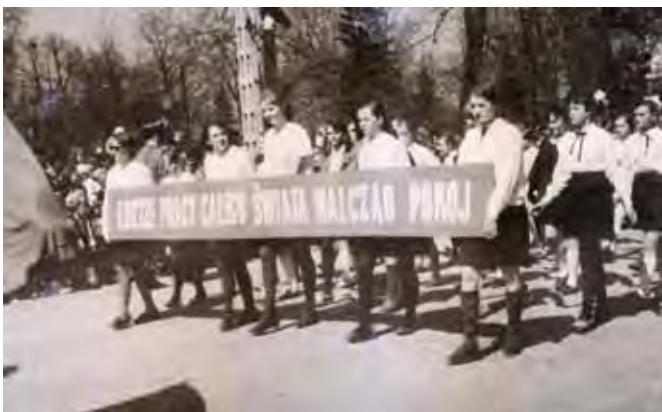
1 Maja 1967 rok