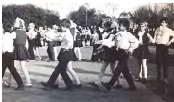
Występy grupy tanecznej